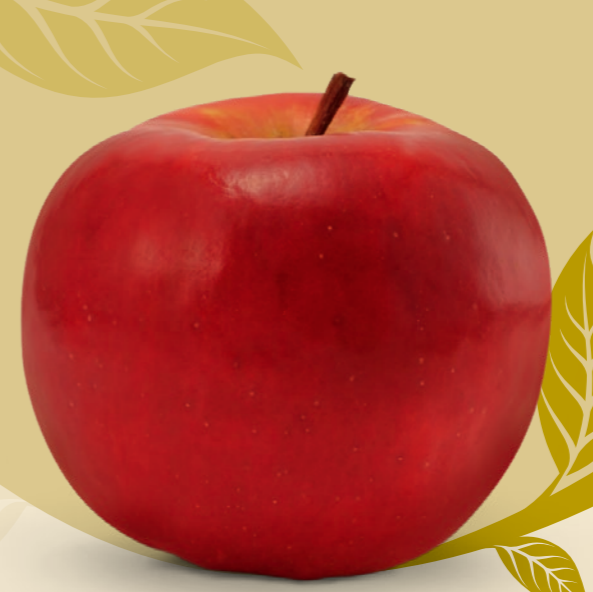
RED TOPAZ ® | Topaz mutációja A BIOTERMESZTÉS ALAPJA