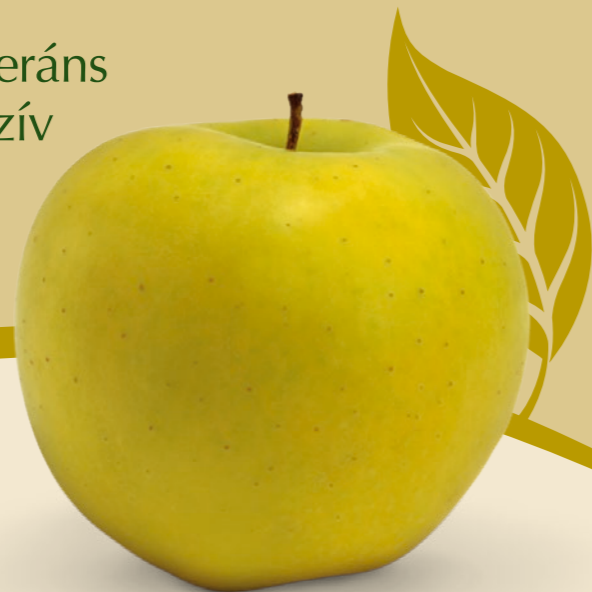
LUNA ® | Topaz x Golden Delicious A JÓL TÁROLHATÓ