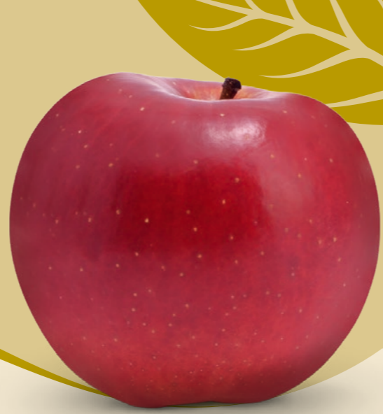
ROZELA ® | Vanda x Bohemia AZ ATTRAKTÍV GYÜMÖLCSÖZÖN