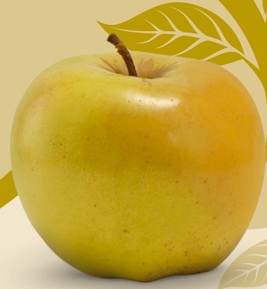
SIRIUS ® | Golden Delicious x Topaz AZ ÍZHARMÓNIA