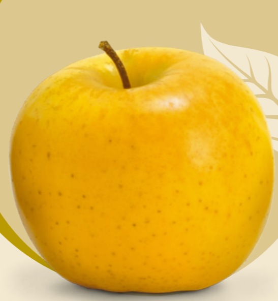
ORION ® | Golden Delicious x Otava A KÜLÖNLEGES ÍZŰ CUKORALMA