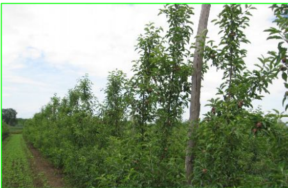
3 éves LUNA® fák Piricsén

És hogy mi újság az ország elsőként telepített Naturalma® ültetvényében? Beszéljenek a képek. A legidősebb M9-es alanyon telepített ilyen ültetvény a Holland Alma Kft. 2010 tavaszán telepített fajtabemutató mintaültetvénye. Ez a kis demonstrációs célokat szolgáló ültetvény kizárólag BIO növényvédelmi elvek szerinti ápolásban részesül. Gombabetegségek ellen főleg elemi réz és kén tartalmú szereket használunk. Az atkákat folyamatosan kén tartalmú szerekekkel tartjuk szinten, a levéltetvek ellen narancsolajjal védekezünk. A lombállapotunk ennek ellenére majd tökéletes. Varasodásnak, lisztharmatnak, atkáknak és levéltetveknek nyoma sincs. Az idén csak a levélpirosító levéltetű okozott egy kis kellemetlenséget. Az ültetvény sorközeit évente zöldtrágyakeveréssel vetjük le, melynek kaszálékát a sorra mulcsozzuk. Ültetvényünkben mind az öt Naturalma® fajta megtalálható. Az elsőként telepített Sirius®, Red Topaz® és a Luna® fajtáink már tavaly is virágoztak és kötöttek, de a fagy leszüretelt helyettünk. Idén a virágzaskori fagy ellenére maradt termés a fákon, mely a június elején készült felvételeken is jól látszik.