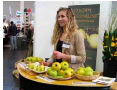
Naturalma fajták közül a sárga színűeket Svájcban és Németországban Golden Sunshine Line néven márkázzák

tulajdonosok bemutatták a legújabb, a fogyasztók és termelők igényeihez még inkább igazodó fajtaújításait, amelyeket természetesen kóstolásra is kínáltak. Az új fajták mellett szép számmal mutatkoztak be azon vállalkozások, akik a természettechnológia, a fitotechnika, a gyümölcsfeldolgozás területén és a kész termékek értékesítésével kapcsolatban kínálták legújabb eszközeiket, szolgáltatásait. A világban folyó fajta-innovációról összességében megállapítható, hogy a trendek egyre inkább a biotermesztésre való alkalmasságot és a rezisztens fajtákat helyezik előtérbe a legtöbb gyümölcsfaj esetében. Mindenképpen hangsúlyosan kiemelték a helyi adottságoknak és helyi fogyasztói igényeknek megfelelő fajtákkal és technológiáival történő gyümölcsstermesztés fontosságát. Az elhangzott előadásában dr. Ulrich Mayr, a bavendorfi Bodeni-tavi Gyümölcsstermesztési Kompetenciacentrum vezető kutatója kiemelte, hogy az új fajták mintegy 80%-a igen roppanós, lédús és igen jó polcállósággal rendelkezik. A jó minőség mellett, amelyek elsősorban a kereskedelmi szférában bírnak döntő jelentőséggel, a termelők számára az is fontos, hogy egy új fajtát a lehető legnagyobb biztonsággal lehessen megtermelni. Ebből kifolyólag mind a kereskedelmi szféra, mind pedig a fogyasztó egyre inkább elvárja, hogy